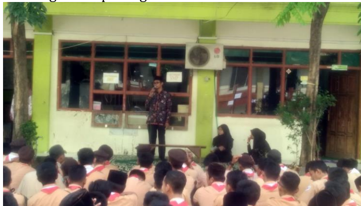
Gambar 3. Kegiatan Apel Pagi Siswa dan Siswi SMK al-Azhar Menganti