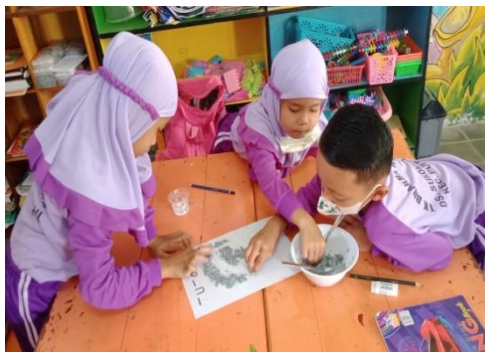
Gambar 3. Anak Berkreasi Membuat Topeng dari Bubur Kertas

Pengambilan data pada siklus 2, kegiatan art and craft yang diterapkan adalah pembuatan karya batik pada tisu pada pertemuan pertama, kemudian pada pertemuan kedua karya yang dibuat adalah topeng dari bubur kertas.