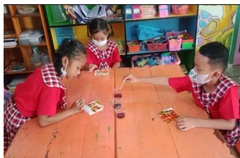
Gambar 4. Anak-anak sedang mengamati perpindahan air menggunakan pewarna makanan dan membuat batik di tisu

Hasil penilaian pada siklus ke-2 menunjukkan bahwa terdapat peningkatan kembali sebesar 36,32% sehingga ketercapaian kelas menjadi 81,82%. Adapun kenaikan ketercapaian kelas di setiap tahapnya dipaparkan dalam tabel 2 berikut ini.