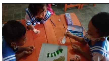
Gambar 2. Anak-Anak sedang membuat lukisan berbusa

Berdasar penilaian kompetensi abad 21 siklus 1 diperoleh hasil secara keseluruhan rata-rata ketercapaian kelas adalah 59,09% dengan kriteria cukup baik (Safitri et al., 2018),