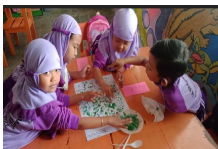
Gambar 1. Anak-anak sedang mencampur warna dasar menjadi warna baru

Berdasarkan hasil penelitian peningkatan kompetensi Abad 21 melalui Art and Craft bagi anak usia 5-6 tahun di TK Dharma Wanita Sukokidul dengan menggunakan Penelitian Tindakan Kelas (PTK) Kemmis & Taggart diperoleh data pada setiap siklusnya sebagai berikut. Pada siklus 1 kegiatan art and craft yang dilaksanakan adalah pembuatan karya tangan teknik finger print pada pertemuan pertama, dan lukisan berbusa pada pertemuan kedua.