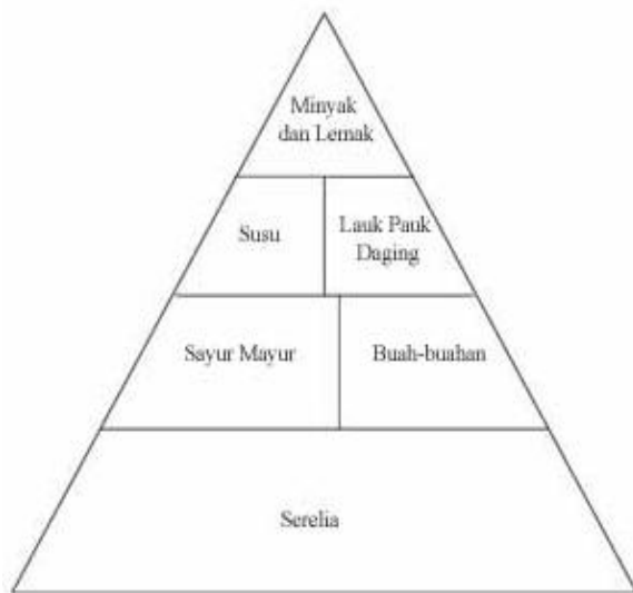
Gambar 1 Pedoman piramida makanan

Pengetahuan tentang bahan makanan diperlukan sebagai dasar untuk menyusun hidangan. Dengan mengetahui komposisi dan penggolongan berbagai macam bahan makanan, seseorang dapat memilih jenis bahan makanan untuk memenuhi kebutuhan