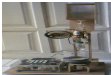
Gambar 3. Rangkaian alat secara keseluruhan