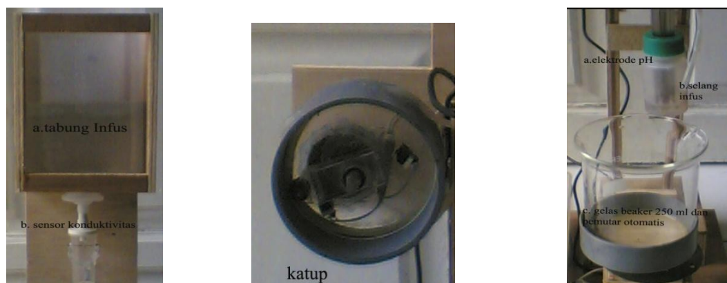
Gambar 5 .a) Rangkaian titran, b) Rangkaian katup, dan c) Rangkaian titer .

Rangkaian titer terdiri dari pH elektrode, selang infus dan gelas beaker. pH elektrode berfungsi sebagai sensor pH yang digunakan untuk mengukur nilai pH yang terdapat pada larutan. Selang infus diatur sedemikian rupa sehingga tetesan NaOH tidak mengenai sensor pH tersebut, sedangkan gelas beaker disini berfungsi sebagai tempat titrasi dan tempat titer (larutan yang diuji). Pada saat titrasi berlangsung, gelas beaker tersebut akan berputar satu arah yang putarannya dikendalikan oleh rangkaian elektronik.