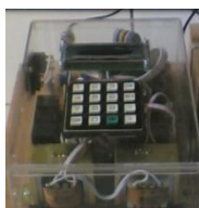
Gambar 4. Rangkaian elektronik

Rangkaian elektronik ini berfungsi untuk mengendalikan sistem rangkaian titrasi secara keseluruhan. Untuk mengendalikan rangkaian secara keseluruhan, maka pada sistem ini ditanamkan software yang mampu menghitung kadar vitamin C pada suatu larutan yang diuji. Rangkaian ini terdapat masukan dari catu daya dan LCD LMB162AFC. Catu daya berfungsi sebagai masukan yang digunakan untuk menjalankan alat tersebut.