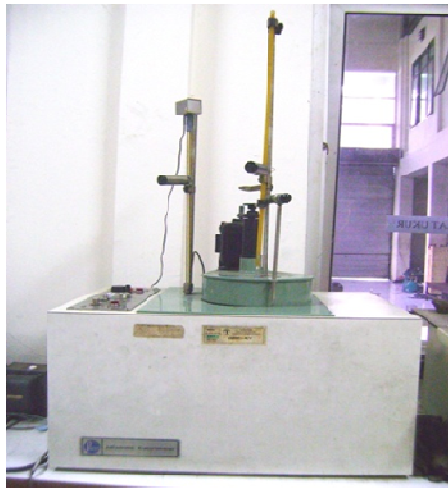
Gambar 1: Bomb Calorimeter Adiabatic