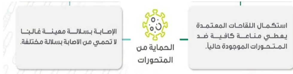
الصورة ٩. اختلاف الحماية من المتحورات

على الأقل بعد استكمال الجرعات، قد تحتاج بعض الفئات إلى جرعة تنشيطية بعد استكمال الجرعات الأولية. بينما في حالة المريض بعد تعرضه للفيروس طبعا فهو مكتوب بعكس الوضع السابق يعنى تختلف وتتناقض مدة المناعة المكتسبة من شخص الأخر مع مرور الوقت، ولا تمنع الإصابة الخفيفة من الإصابة مرة أخرى بالعدوى.