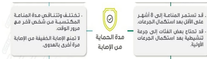
الصورة ٨. اختلاف مدة الحماية من الإصابة

اختلافات في الاستجابة المناعية أو جهاز المناعة التي يمكن قياسها من المجموعات المصابة بفيروس كوفيد-19 ومدى تأثير الفيروس على الشخص المصاب. في الملصق الذي أصبح هذه المرحلة مكتوبًا أن التأثير سيحدث بعد أن يقوم المريض بإجراء التطعيم يعني تفال درجة استجابة الجهاز المناعي ضد الفيروس عند كبار السن والمصابين بالأمراض ومن يستخدمون ادوية تؤثر على الجهاز المناعي لذا التطعيم يحفز ويستحث الأجسام المناعية الفعالة ضد الفيروس. بينما في حالة المريض بعد تعرضه للفيروس طبعًا فهو مكتوب بعكس الوضع السابق يعني تختلف الاستجابة من شخص الآخر، تؤثر على أعضاء ووظائف الجسم، وقد تسبب المضاعفات الطويلة الأمد.