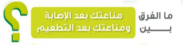
الصورة ٥. اختلاف الحال

قبل حكومة المملكة العربية السعودية يحمل رمز الشعار أو مرتبطاً بالحكومة ليكون لديه ثقة الجمهور في تنفيذ التطعيمات التي أعدتها الحكومة.