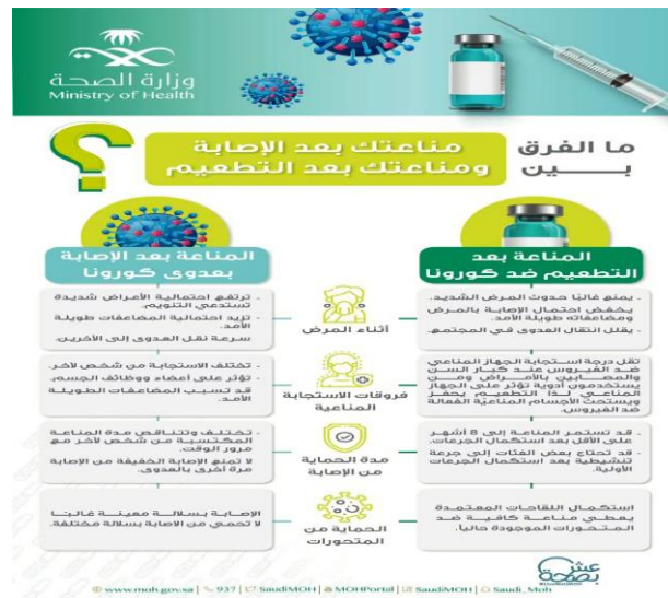
الصورة ١. خطّة

المراجع: https://twitter.com/SaudiMOH/status/1438563335985893379?s=20&t=IH4QChJrTK7bhZRnTLqPbQ