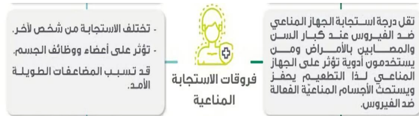
الصورة ٧. اختلاف فروقات الاستجابة المناعية

المرحلة السادسة، الرمز الموجود هو صورة الشخص الذي يسعل. من المؤكد أن المرضى هم مرجع لكل شخص يحتاج إلى علاج المرض حتى يشعر بالشفاء. في الملصق المتعلق بفيروس كوفيد-١٩ والتطعيم، من بين الرموز التي أصبحت علامة تم شرحها وشرحها بوضوح، ما هي الظروف التي تحدث في كل فرد عندما يتم تطعيمه أو بعد فيروس كوفيد-١٩. في الملصق الذي أصبح هذه المرحلة مكتوبًا أن التأثير سيحدث بعد أن يقوم المريض بإجراء التطعيم يعنى يمنع غالبًا حدوث المرض الشديد، يخفض احتمال الإصابة بالمرض ومضاعفته طويلة الأمد، يقلل انتقال العدوى في المجتمع. بينما في حالة المريض بعد تعرضه للفيروس طبعًا فهو مكتوب بعكس الوضع السابق يعنى ترتفع احتمالية الأعراض شديدة تستدعي التنويم، تزيد احتمالية المضاعفات طويلة الأمد، وسرعة نقل العدوى إلى الآخرين.