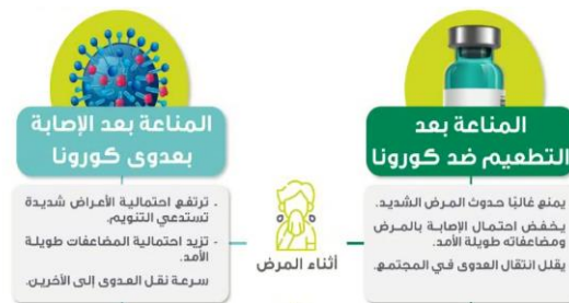
الصورة ٦. اختلاف اثناء المريض

المرحلة الخامسة، والرمز في هذه المرحلة هو علامة استفهام يجب أن يكون لها إجابة دقيقة ودقيقة. توضح علامة الاستفهام الوضع الأفضل بالنسبة للمجتمع، بحيث يصبح هذا القلق ضرورة يجب على الجميع تطبيقها من أجل إنقاذ أنفسهم من مخاطر الفيروس الموجود.