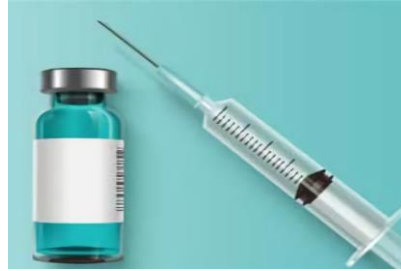
الصورة ٢. تحصين

مقارنة الحالات بين ما بعد التطعيم وبعد التعرض لفيروس كوفيد-١٩ من أجل إطلاعنا على الآراء التي يجب الالتزام بها على أساس الحكومة السعودية لصحة شعبيها.