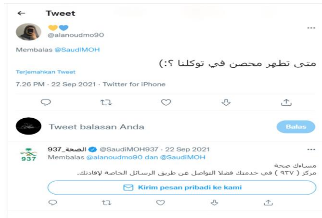
الصورة ١٢. تعليقات متابعي حساب @SaudiMOH