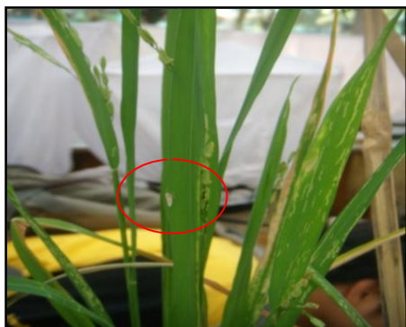
Gambar 5. Serangga Hama Wereng Punggung Putih ( Sogatella furcifera Horvath) di Padi

Tingginya serangan serangga predator Synharmonia conglobata Linnaeus terhadap wereng punggung putih ( Sogatella furcifera Horvath) pada waktu terang dibandingkan pada waktu gelap, dikarenakan predator ini aktif pada siang hari. Menurut Simanjuntak (2002), bahwa predator Coccinella sp aktif mencari makan pada pagi hari setelah matahari terbit. Sedangkan rendahnya daya predasi predator Synharmonia conglobata Linnaeus terhadap wereng punggung putih ( Sogatella furcifera Horvath) pada waktu gelap dikarenakan predator dalam keadaan hibernasi. Hal ini didukung oleh pendapat Wagiman (1997) dalam Tobing dan Nasution (2008) bahwa predator dari familia Coccinellidae mempunyai aktivitas makan lebih tinggi pada waktu terang dibanding waktu gelap.