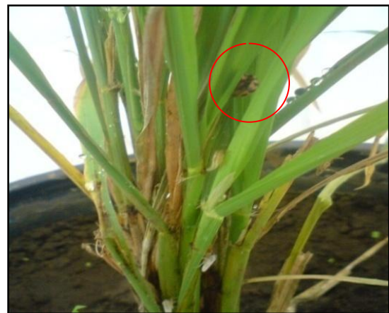
Gambar 6. Serangga Predator di Tanaman Padi

Hal ini sesuai dengan pendapat Hufaker dan Messenger (1989), bahwa mengamati suatu predator sedang makan suatu spesies mangsa tertentu saja, belum cukup untuk menyimpulkan bahwa spesies tersebut merupakan suatu mangsa yang disukai atau spesifik. Maka dari itu perlu penelitian lebih lanjut mengenai predasi serangga predator Synharmonia conglobata Linnaeus terhadap beberapa hama, dalam satu kandang percobaan, untuk memastikan mangsa spesifik dari predator Synharmonia conglobata Linnaeus.