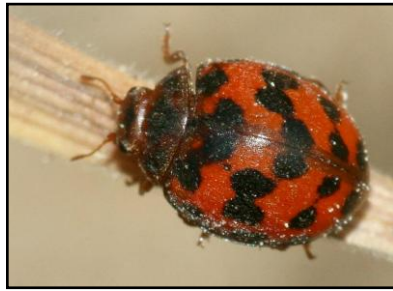
Gambar 2. Morfologi Predator Synharmonia conglobata Linnaeus Sayap Depan ( elytra ) Berwarna Merah Mengkilat Disertai Bintik-bintik Hitam. Mempunyai Ukuran Tubuh 6 – 7 mm. ( www.rutkies.de/kaefer/index.html ).

persawahan tidak dibatasi dalam hal usia, ukuran dan berat serangga, hanya fase imago yang diambil.