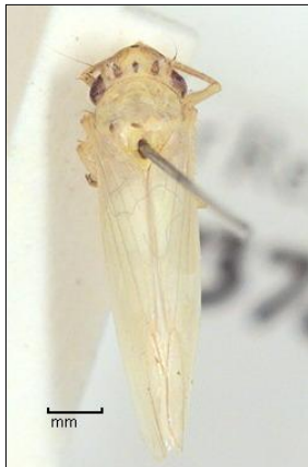
Gambar 3. Morfologi Wereng Punggung Putih ( Sogatella furcifera Horvath) dengan Punggung Berwarna Putih Dengan Bercak Hitam Dibagian Atas Abdomen. Panjang Tubuh 3 – 5 mm. ( http://rdmessage.msoffice7.9.ENU ).

Serangga hama wereng punggung putih ( Sogatella furcifera Horvath) yang diaklimatisasi, diambil sebanyak 25 ekor dan serangga predator Synharmonia conglobata Linnaeus sebanyak 2 ekor. Kedua jenis serangga tersebut dimasukkan ke dalam kurungan yang sudah berisi tanaman padi varietas IR 64 umur \pm 1,5 bulan.