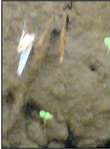
Gambar 7. Mortalitas Serangga Hama Wereng Punggung Putih

responsi gigitan oleh predator dan menentukan diterima atau tidaknya suatu mangsa.