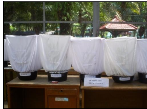
Gambar 1. Kurungan Percobaan

Kurungan dibuat dari kayu bambu dengan diameter 50 x 40 cm berbentuk persegi panjang. Selanjutnya kurungan ditutup dengan kain saring berwarna putih dengan diameter 50 x 40 cm yang ukurannya sama dengan kerangka dari bambu. Pada sisi samping kurungan diberi lubang yang sudah diberi kretekan untuk mempermudah memasukkan predator dan hama serta untuk pengamatan.