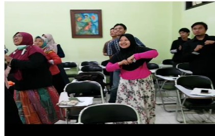
الصورة ٧: يعمل الطلبة استرخاء معاً بالفرحة

الاسترخاء هو تنظيم الفرد بعمل الحركة البدني أو الفكري. وجعل الاسترخاء تركيز الذهن وممارسة انتباه بالوعي الكامل. وهو يناب العضلات للراحة بعد عملها أو حالة المريحة دون الشعور الشديدة السلبية. وقال Gunarsa أن الاسترخاء حالة في المريح وشعور بالهدوء دون المتوتر والضغط القوي (Sutarjo et al., 2014). وذكر أن الاسترخاء بلعبة المخ Brain Gym يستطيع تخفيف مشبع الطلبة في التعليم وأيضاً بالفيديو والموسيقى. أن الاسترخاء يستطيع تخفيف القلق وينبأ شعور السعادة والفرحة ونقصان الخوف. وهذا يستطيع أن يعمل الحركة كاللعب والرياضة أو المسافة والأخرى وهذا النحو كالصورة التالية: