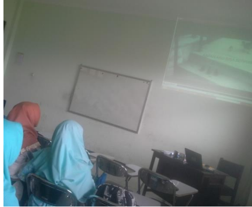
الصورة ٦: يشهد الطلبة الفلم الدافعة لمريحة الفكر

قال Lozanow أن الإيحائية عملية بتقديم الآراء ليعمل الناس أشياءً بالإيحاء ويجعل فكرة الناس هدوئه ومريحة حتى ما يلقي إليهم لأن يتفوقوا جيدا بطول الوقت. وعملية الإيحائية بالمكان الجميل والبيئة الممتعة والصوت من الموسيقى أو الفيديو والتقنيات الدرامية من المعلم في إلقاء الإيحاء. وتستطيع الإيحائية تخفيف الإيحاء السلبي (Arsyad & Majid, 2010) وشعور كضعيفة العقل وخوف الخطاء وخوف الحالة الجديدة. وقد بحث كسومارين عن تنمية كفاءة الطلبة في الكتابة تستخدم الإيحائية بتقديم الإيحاء إلى الطلبة حتى لديهم الثقة الدقيقة باستخدام الغناء والفيديو. وهذا العمل قد ارتفع كفاءة الطلبة في الكتابة (Kusumarini, 2013).