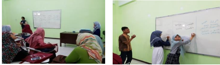
الصورة ٢: المعلم والطلبة يتفاعلون في بحث مادة التعليم في اللقاء المباشر في الفصل

تعليم مهارة الكتابة يحتاج التعليم بأسلوب الكلام الطيبة (earning of rhetorics) لدى الطلبة مباشرة (Shittu & Abdullahi, 2020). والصورة المناسبة بالشرح قبله هي كما يلي: