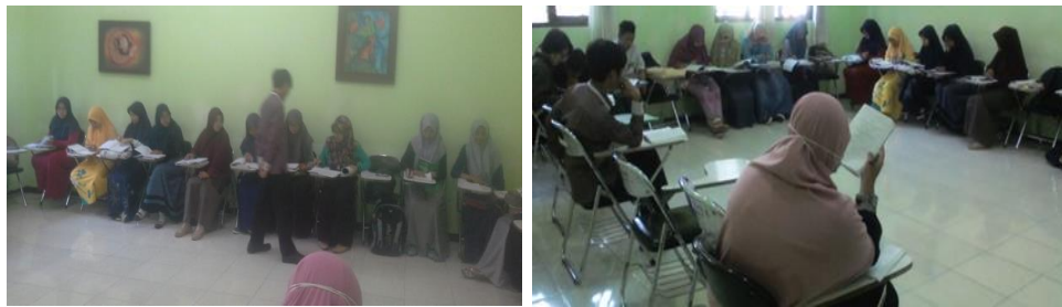
الصورة ٣: الطالب يتقدم أمام الفصل لشرح ما كتب وهو يحكي ذاتيا بالثقة العميقة

التعليم ذاتيا هو يتعلم الطلبة فرديا ولهم حرية العمل باختيار ما يراود. وفيه استخدام الكتاب الدراسي أو الاللكترونيكي وتنظيم المعلم ومناقشة حينما يحتاج. وقال Panen و Sekarwinahyu في رومان أنهما طبقا التعليم ذاتيا في وجه اختيار مصادر المواد التعليمية وكيفية تعليمها حسب (Kurniawati, 2016). أن جودة التربية في كل الفرد مرتفعة حين مرتفعة كفاءة تعليمه بكيفية التعليم أسرع ومذكرته أكثر. واكتساب مصادر الدرس من الصحيفة والمجلة والتلفاز والمذياع والمكتبة وما لا يتعلّق بالناس. والتعليم ذاتيا يستطيع تطوير منظّم الذاتى والفر ينظّم ذاتيا يدل على الثقة لقدرتهم في حل المشكلات دون مساعدة الآخرين، وفيه يختار الفرد المراحل المحبة المرجوة ويظهر الدافعة المرتفعة وتصور الصورة على هذا في التالي: