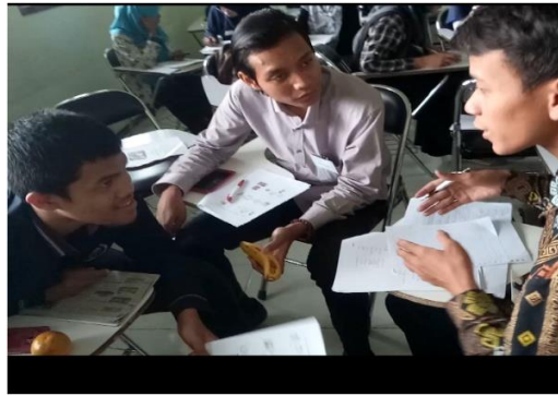
الصورة ٤: الطلبة في تعليم الكتابة بالمحاكاة والتمثيلية مع الفواكه

الحالة الحقيقية. في عملية المحاكاة تمثيل. والتمثيل نموذج وهو الآلات أو الأجهزة كالأشياء الحقيقية يستخدمها المعلم في العملية التعليمية. التمثيل اثنين وهما تمثيل مباشر وتمثيل غير مباشر. واستخدام التمثيل في التعليم للوسيلة التعليمية البصرية (Hamid et al., 2008). أن التمثيل المباشر يستطيع أن يحمله المعلم في الفصل ميسراً وسهلاً، والتمثيل غير المباشر فعالة في استخدامه. وهذا الطلبة بالفرقة والفرقة ثم المعلم يعطي التمثيل كالفواكه والطلبة يجبون أن يصفوا الفواكه بالكتابة ويصنفون النص.