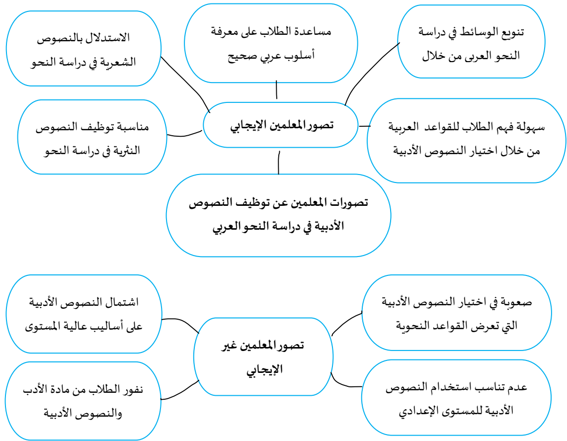
الشكل ٢: تصورات المعلمين عن توظيف النصوص الأدبية في دراسة النحو العربي

يسعى السؤال الثاني إلى الوقوف على تصورات معلمي اللغة العربية حول استخدام النصوص الأدبية في دراسة النحو العربي. وقد أشار البحث الحالي إلى أن معلمي اللغة العربية في جامعة برليس الإسلامية طرحوا تصورات إيجابية عن توظيف النصوص الأدبية في دراسة النحو العربي. ومنها مساعدة الطلاب على معرفة أساليب عربية صحيحة، وهم قبل ذلك كانوا يحاكون الأمثلة من الأساليب البسيطة المتقطعة الموجودة في الكتاب المقرر فقط. وقد وافق المعلم أيضا على توظيف النصوص الأدبية في عملية تعليم النحو العربي؛ لاختلاف الأسلوب الذي يتعود به الطلاب في تعلم النحو، فتنوع الوسائل في دراسة النحو مهم لبعدهم عن الشعور بالملل.