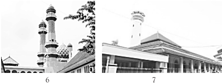
Gambar 6. Keberadaan atap tajug semakin tenggelam oleh dominasi atap dan menara berkubah. Gambar 7. Masjid lama Ampel yang menunjukkan adanya kombinasi antara unsur berlanggam Nusantara (Jawa) dengan unsur berlanggam Indische Empire