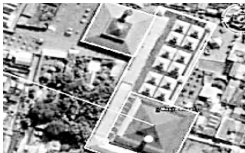
Gambar 3. Site Plan Masjid Ampel. Masjid lama beratap hijau, sedangkan bangunan tambahan dan masjid baru beratap merah