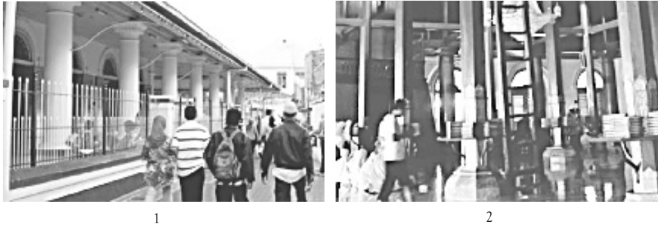
Gambar 1. Bangunan masjid Ampel lama, memiliki kombinasi langgam Jawa dengan seperti yang ditunjukkan oleh kolom besar dan pintu yang lebar.