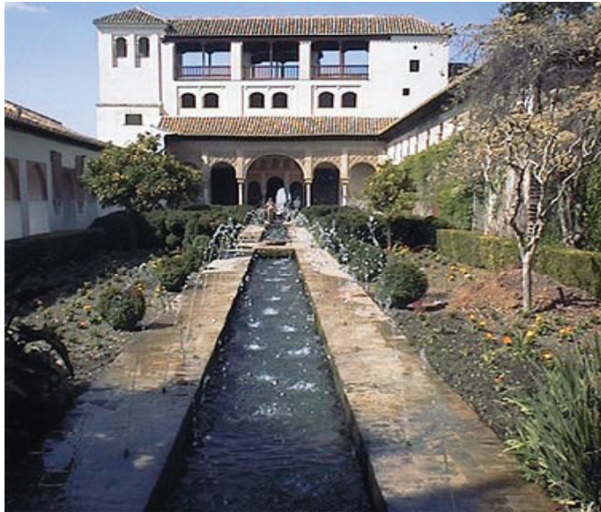
Gambar 3. Alhambra, Spanyol, dikenal sebagai salah satu contoh taman Islam

Di sisi lain, pada dasarnya Islam memberikan kebebasan kepada pemeluknya untuk berkreasi dalam membuat taman-taman sesuai dengan lokasi dan kebutuhan penggunaannya. Hal yang harus diperhatikan adalah batasan-batasan secara syariah agar taman yang dibuat tetap dalam koridor ajaran Islam. Pada Tabel 4, terlihat bahwa beberapa hal yang menjadi batasan utama bukanlah mengenai ruang, bentukan, pola, atau elemen, melainkan lebih kepada aspek fungsional taman yang tidak bertentangan dengan ajaran Islam, seperti tidak digunakan untuk mempersekutukan Allah SWT memperhatikan keseimbangan dengan alam, tidak merusak, bermanfaat, serta penggunaannya dapat berpenampilan dan bersikap sesuai dengan ajaran Islam. Selebihnya, sebagai bagian dari muamalah yang memiliki hukum asal boleh, hal apa pun pada dasarnya tidak bermasalah untuk diterapkan dalam sebuah taman Islam. Kebebasan ini menjadikan dapat terlahirnya beragam konsep desain taman Islam yang dapat disesuaikan dengan kondisi yang ada ( existing ) dari lingkungan dan kebutuhan pengguna yang relatif berbeda antara suatu tapak dengan tapak lainnya.