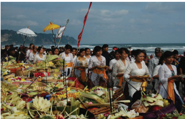
Gambar 3. Labuhan Melasti sesaji

Labuhan khusus orang Hindu (melasti sesaji), yaitu Labuhan yang diadakan oleh umat Hindu untuk menyambut datangnya hari Raya Nyepi. Upacara ini dilakukan setiap bulan Februari.