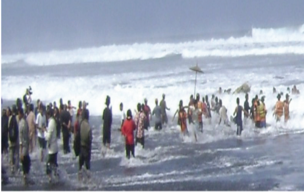
Gambar 2. Upacara Labuhan di Pantai Depok

Labuhan dari para nelayan adalah sedekah laut yang biasanya diadakan oleh para nelayan setiap tanggal 16 Februari. Labuhan ini diadakan di pantai Depok, tepatnya di Tempat Pelelangan Ikan (TPI) Bungkus.