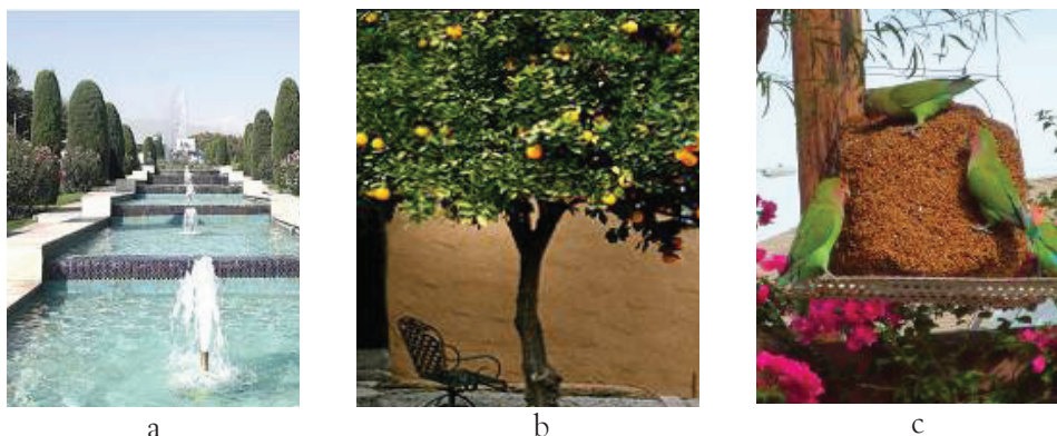
Gambar 2. Air (a), tumbuhan (b), dan hewan (c) sebagai elemen lunak pada taman

Elemen keras ( hardscape ) yang disebutkan dalam al Quran dan hadits meliputi bangunan-bangunan taman, pintu, dan elemen-elemen lainnya. Hal ini menunjukkan bahwa pada taman surga terdapat keseimbangan antara elemen yang bersifat alami dan buatan. Bangunan-bangunan taman dideskripsikan sebagai tempat tinggal yang paling baik dan indah, disebutkan pula bahwa bangunan-bangunan tersebut terbuat dari mutiara (HR. Muslim No. 5070). Sementara itu, surga digambarkan memiliki lebih dari satu pintu, masing-masing pintunya menerima kedatangan pengguna dengan kriteria yang spesifik (HR. Bukhari No. 3017). Mengenai hardscape lain, tercatat beberapa hal, yaitu bantal (QS 88: 15), permadani (QS 55: 54), dipan (QS 52: 20), gelas (QS 43: 71), piala (QS 76: 15), piring (QS 43: 71), dan bejana (QS 76: 15) (Depag, 2002: 803, 866, 888, 1004, 1054). Keseluruhan elemen keras ini didesain untuk dapat dioptimalkan oleh penghuninya. Maka, dalam perancangan dan desain sebuah taman, sebaiknya diperhatikan hingga detail elemen-elemen keras yang digunakan, kemudian harus dipastikan bahwa elemen-elemen tersebut sesuai dengan kebutuhan penggunanya agar dapat berfungsi optimal.