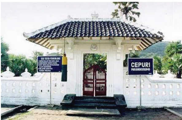
Gambar 1. Cepuri Parangkusumo

Pisusung Jaladri Bhekti Pertiwi , yaitu upacara perwujudan rasa syukur masyarakat Parangtritis kepada Tuhan atas rizki yang dilimpahkan. Labuhan ini dilaksanakan oleh masyarakat Parangtritis setiap tanggal 5 dan 6 pada bulan Mei sampai Juni (setelah panen). Prosesinya adalah pada hari Senin Pon, masyarakat memasang sesaji ditempat keramat yang terletak di Desa Parangtritis (makam Syaikh Belabelu, Makam Syaikh Maulana Maghribi, dan di Cepuri). Kemudian pada hari Selasa Wage, diadakan Bhekti Pertiwi di pendopo Parangtritis dengan membawa sesaji dan doa bersama. Desain upacaranya adalah setiap RT membawa 1 (satu) jodhang persembahkan kemudian diarak dari pendopo Joglo Parangtritis, selanjutnya dibawa bersama-sama ke pantai dan dilabuh di pantai Parangkusumo. Adapun sesepuh yang biasanya memimpin doa dan yang melabuh sekaligus, yaitu: pertama , Raden Panewu Surakso Tarwono, sesepuh dari Keraton dan juga juru kunci Cepuri; kedua , Raden Sumardi Jiwo Rejo dan Bapak Budi Asih Suparno, yaitu seorang penghayat kepercayaan Trisuka.