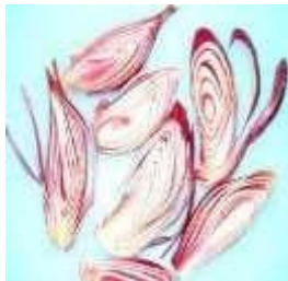
Gambar 1. Parutan Eleutherine palmifolia (L.) Merr

Menurut Puspawati dkk (2013), secara empiris umbi dari bawang dayak ( Eleutherine palmifolia (L.) Merr) bersifat diuretik, astringen, pencahar dan analgetik. Selain itu, umbi bawang dayak ( Eleutherine palmifolia (L.) Merr) juga dikenal memiliki khasiat untuk mengatasi bisul atau penyakit kulit. Cara penggunaannya yaitu dengan menempelkan parutan umbi bawang dayak ( Eleutherine palmifolia (L.) Merr) pada daerah yang luka (Puspawati dkk., 2013). Parutan umbi bawang dayak ( Eleutherine palmifolia (L.) Merr) ditunjukkan pada gambar 1.