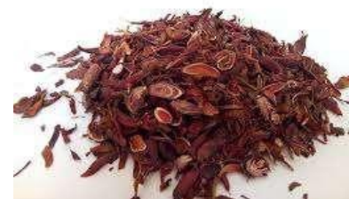
Gambar 3. Eleutherine palmifolia (L.) Merr Kering

Tanaman bawang dayak ( Eleutherine palmifolia (L.) Merr) juga digunakan sebagai fitoterapi dalam bentuk teh untuk mengobati diare yang disebabkan oleh amoeba ( Entamoeba histolytica / Entamoeba dispar ) (Nascimento dkk., 2012). Selama ini masyarakat Kalimantan juga mempercayai bawang dayak ( Eleutherine palmifolia (L.) Merr) sebagai obat tradisional yang memiliki potensi sebagai herba antikanker (Sudarmawan dkk, 2010). Secara empiris, umbi bawang dayak ( Eleutherine palmifolia (L.) Merr) digunakan sebagai obat kanker dengan cara mengeringkan umbi dan mengunyahnya (Naspiyah dkk., 2014). Umbi bawang dayak ( Eleutherine palmifolia (L.) Merr) yang telah dikeringkan ditunjukkan pada gambar 3.