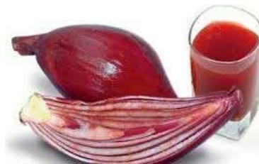
Gambar 2. Air Rebusan Eleutherine palmifolia (L.) Merr

dengan 2 umbi sekali konsumsi. Selain itu, dapat juga dilakukan dengan mengambil 10 bagian umbi dari bawang dayak ( Eleutherine palmifolia (L.) Merr), kemudian direbus dengan 3 gelas air hingga tersisa 1½ gelas dan diminum 3 kali sehari, yaitu ½ gelas untuk sekali minum (Naspiyah dkk., 2014). Air rebusan umbi bawang dayak ( Eleutherine palmifolia (L.) Merr) ditunjukkan pada gambar 2.