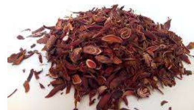
Gambar 3. Eleutherine palmifolia (L.) Merr Kering

Tanaman bawang dayak ( Eleutherine palmifolia (L.) Merr) juga digunakan sebagai fitoterapi dalam bentuk teh untuk mengobati diare yang disebabkan oleh amoeba ( Entamoeba histolytica / Entamoeba dispar ) (Nascimento dkk., 2012). Selama ini masyarakat Kalimantan juga mempercayai bawang dayak ( Eleutherine palmifolia (L.) Merr) sebagai obat tradisional yang memiliki potensi sebagai herba antikanker (Sudarmawan dkk., 2010). Secara empiris, umbi bawang dayak ( Eleutherine palmifolia (L.) Merr) digunakan sebagai obat kanker dengan cara mengeringkan umbi dan mengunyahnya (Naspiyah dkk., 2014). Umbi bawang dayak ( Eleutherine palmifolia (L.) Merr) yang telah dikeringkan ditunjukkan pada gambar 3.