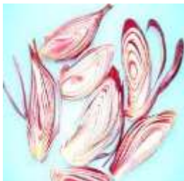
Gambar 1. Parutan Eleutherine palmifolia (L.) Merr

Menurut Puspawati dkk (2013), secara empiris umbi dari bawang dayak ( Eleutherine palmifolia (L.) Merr) bersifat diuretik, astringen, pencahar dan analgetik. Selain itu, umbi bawang dayak ( Eleutherine palmifolia (L.) Merr) juga dikenal memiliki khasiat untuk mengatasi bisul atau penyakit kulit. Cara penggunaannya yaitu dengan menempelkan parutan umbi bawang dayak ( Eleutherine palmifolia (L.) Merr) pada daerah yang luka (Puspawati dkk., 2013). Parutan umbi bawang dayak ( Eleutherine palmifolia (L.) Merr) ditunjukkan pada gambar 1.