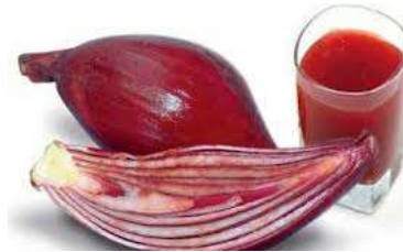
Gambar 2. Air Rebusan Eleutherine palmifolia (L.) Merr

dengan 2 umbi sekali konsumsi. Selain itu, dapat juga dilakukan dengan mengambil 10 bagian umbi dari bawang dayak ( Eleutherine palmifolia (L.) Merr), kemudian direbus dengan 3 gelas air hingga tersisa 1 1/2 gelas dan diminum 3 kali sehari, yaitu 1/2 gelas untuk sekali minum (Naspiyah dkk., 2014). Air rebusan umbi bawang dayak ( Eleutherine palmifolia (L.) Merr) ditunjukkan pada gambar 2.