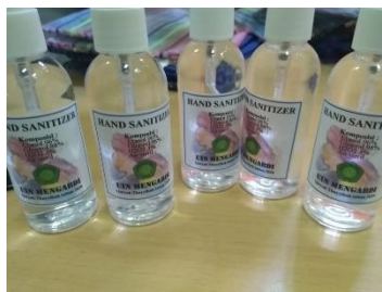
Gambar 2. Hasil praktek pembuatan Hand sanitizer sesuai standar WHO (Dok. Pribadi)

Kegiatan partisipasi “Tomat Estu” dengan cara memberikan bantuan kepada tiap RT yang sudah ada papan untuk menggantungkan bahan makanan. Papan untuk menggantung ini sudah ada sebelumnya, sehingga tim Pengabdian kepada Masyarakat tinggal mengisi saja. Slogan “Tomat Estu: adalah “boleh ambil seperlunya, boleh taruh seikhlasnya” akan mengajak masyarakat untuk saling meningkatkan solidaritas. Pada saat mengambil barang yang dibutuhkan, diharapkan adanya rasa sungkan apabila hanya sekedar mengambil barang. Sehingga masyarakat diharapkan akan tergerak untuk menaruh barang yang dimiliki. Selain itu masyarakat juga dapat saling bertukar barang yang mereka inginkan. Mereka bebas untuk meletakkan di cantolan “Tomat Estu”, dapat berupa kopi, beras, gula, detergen, minyak goreng, hingga hasil pertanian seperti kol, sawi, wortel dan lain sebagainya.