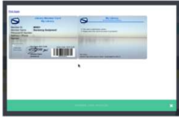
Gambar 3.4 Pembuatan Kartu Keanggotaan dalam Aplikasi Slims 8