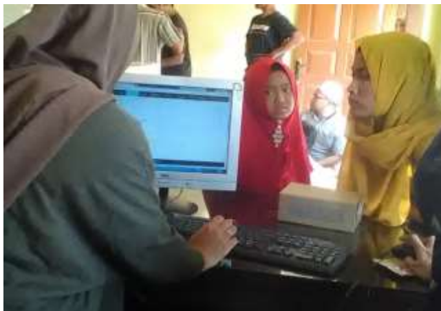
Gambar 3.6 Workshop manajemen rumah baca