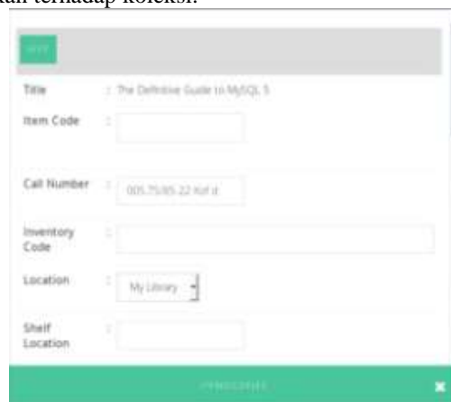
Gambar 3.1 Cataloging Module dalam Aplikasi Slims 8

Fitur untuk membuat, mengedit, dan menghapus data bibliografi sesuai dengan standar deskripsi bibliografi. Mendukung pengelolaan koleksi dalam berbagai macam format seperti monograph, terbitan berseri, audio visual, dsb. Mendukung penyimpanan data bibliografi dari situs di Internet. Mendukung penggunaan Barcode. Manajemen item koleksi untuk dokumen dengan banyak kopi dan format yang berbeda. Pengelolaan koleksi yang hilang, dalam perbaikan, dan rusak serta pencatatan statusnya untuk dilakukan pergantian/perbaikan terhadap koleksi.