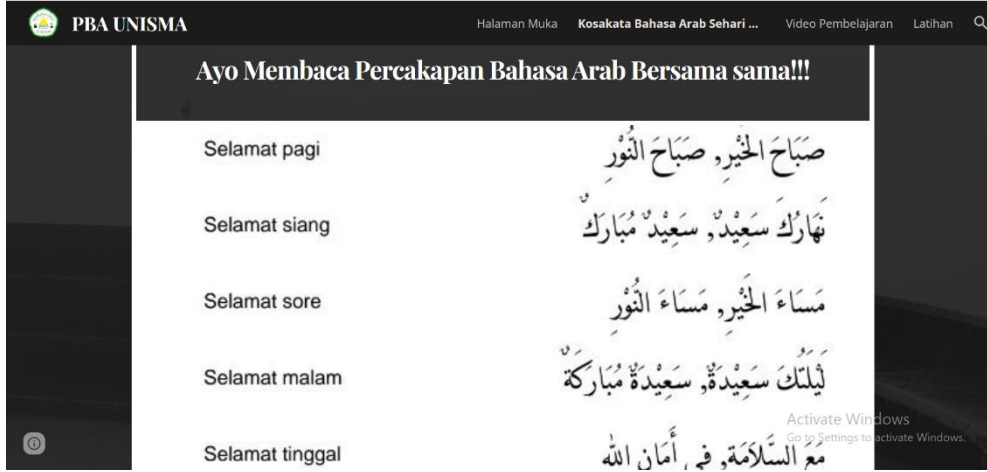
الشكل ٢. عرض صفحة المواد