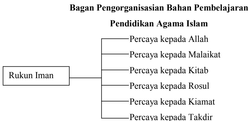
Gambar 2.2 Bagan Pengorganisasian Bahan Pembelajaran PAI